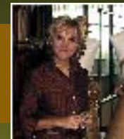
Catycris (tendas de moda)